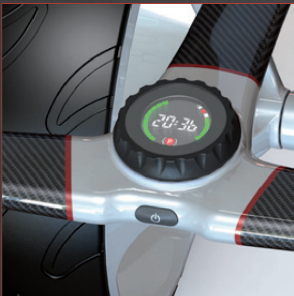
Poignée ergonomique avec LED