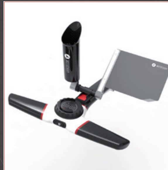
Livré avec tous les accessoires